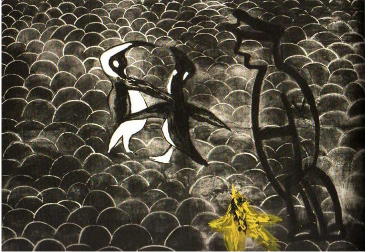
Fred Bervoets - De pinguins