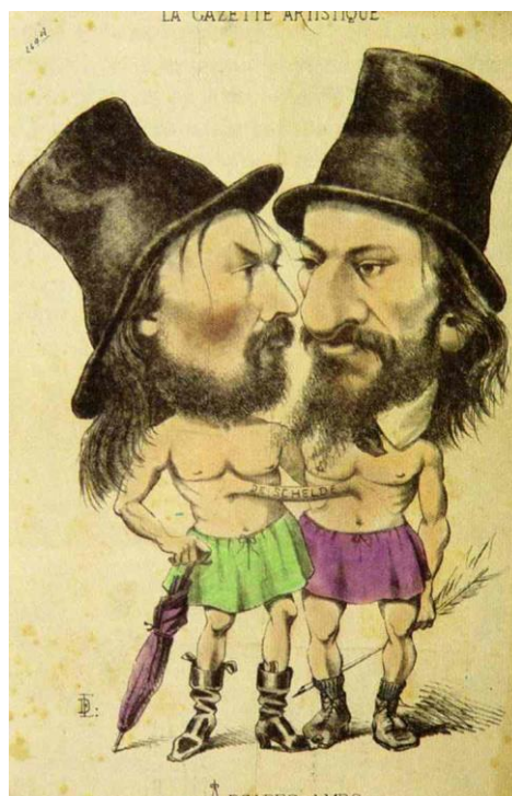
Benoit en Hiel verbonden door De Schelde